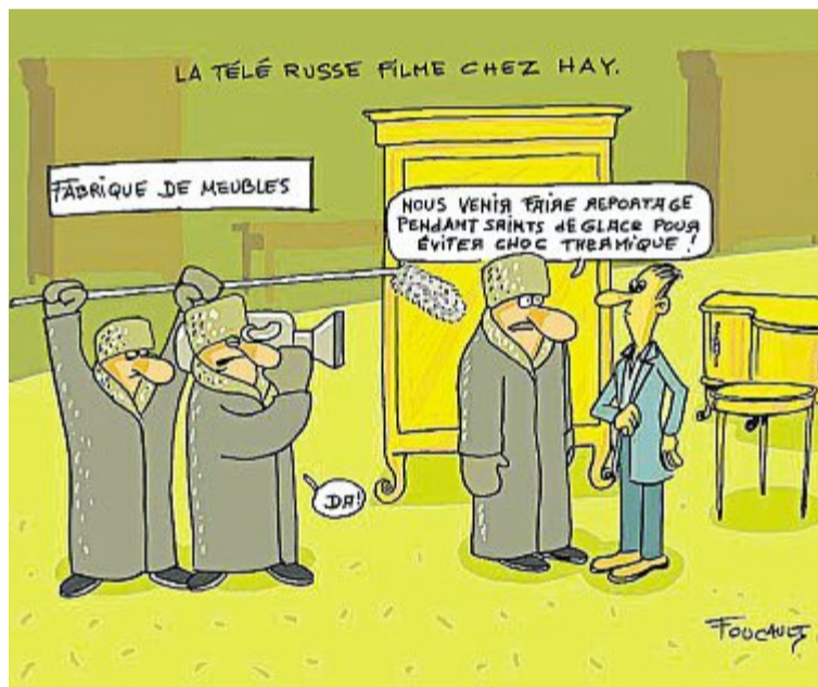
Une équipe de télévision russe va filmer les Meubles Hay à Boismé.